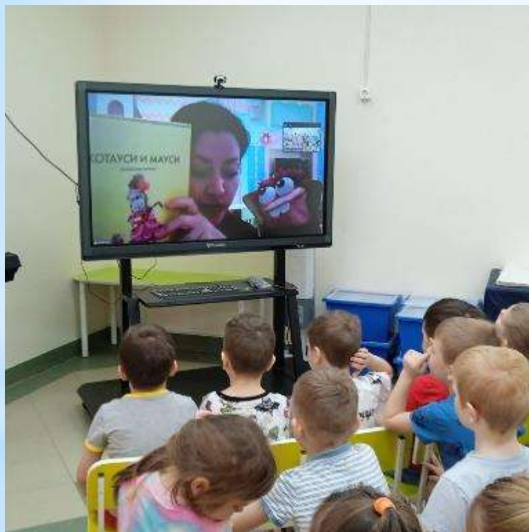
ОНЛАЙН-ЭКСКУРСИЯ «ДОМ, ГДЕ ЖИВУТ КНИГИ»