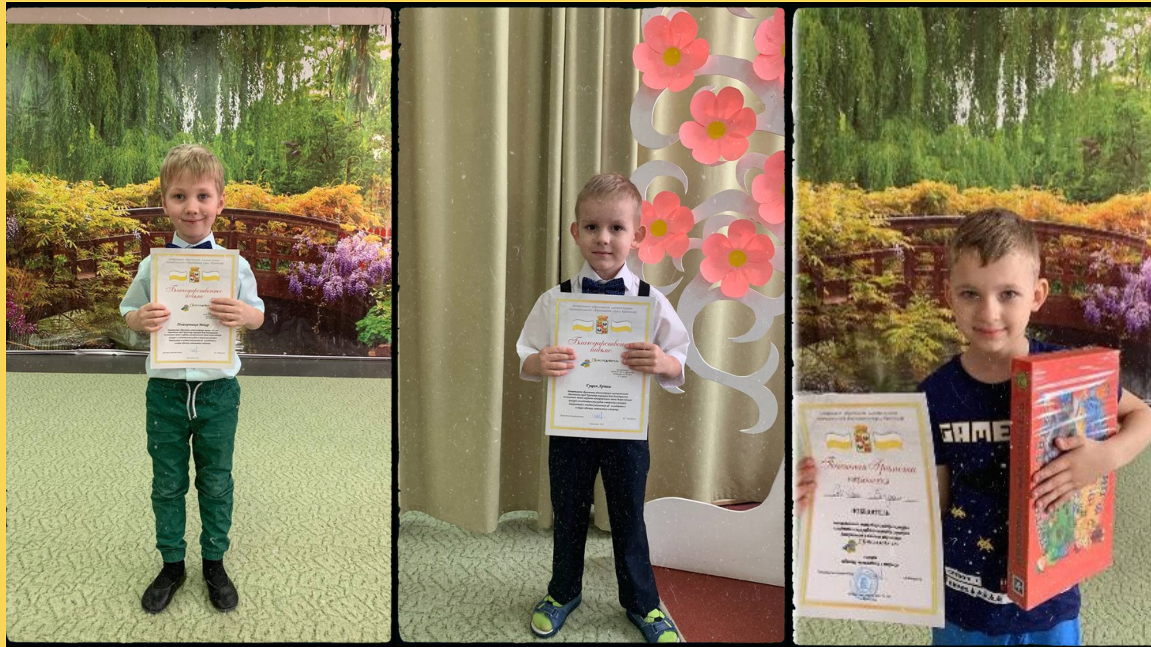
Победы воспитанников в конкурсе "Я-исследователь"