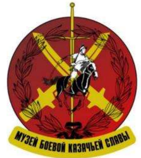
МАОУ СОШ №61