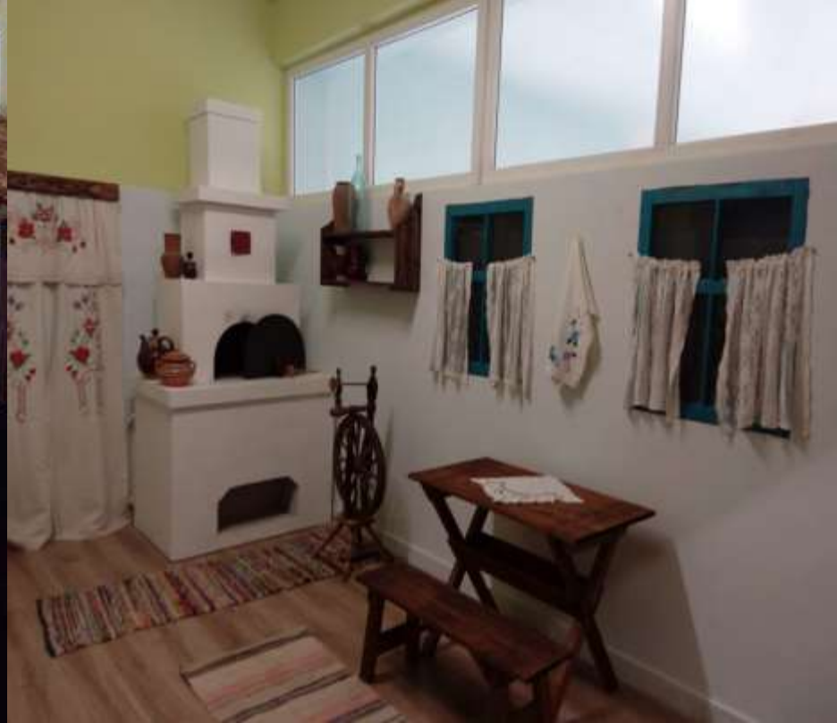
Экспозиция «Казачья хата»