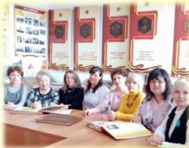
Заседания круглого стола, форумы, фестивали