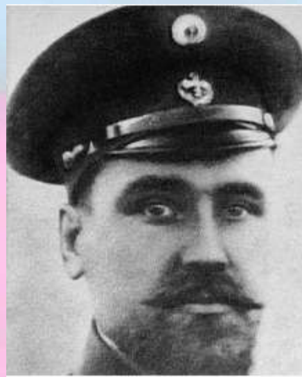
Валериан Иванович Альбанов