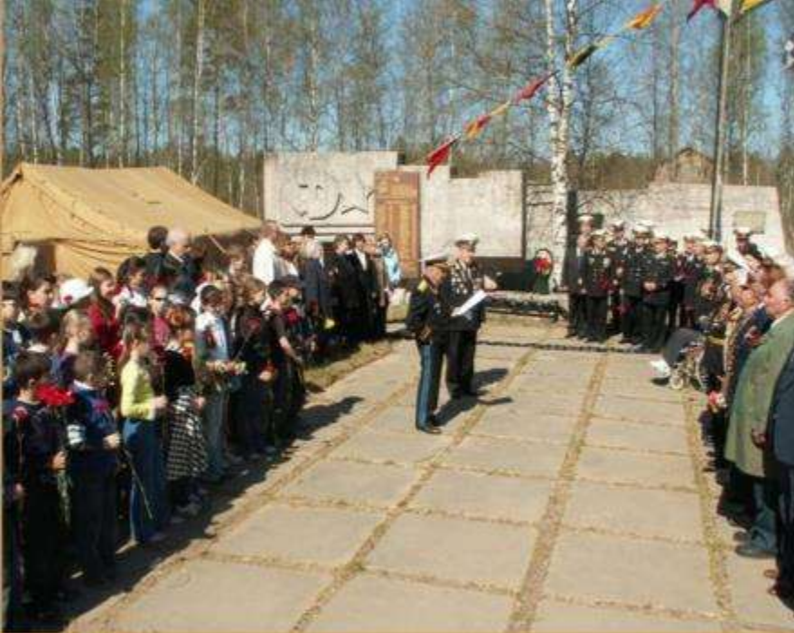
Кронштадт. 2008 г.