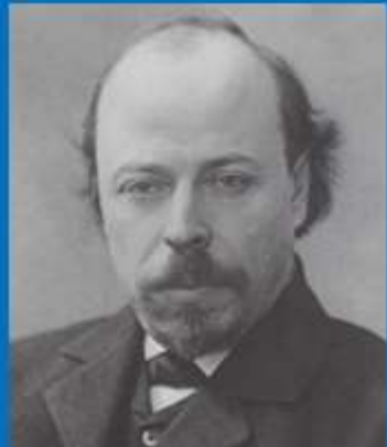
Михаил Васильевич Нестеров