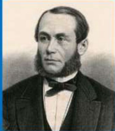
Пётр Петрович Пекарский