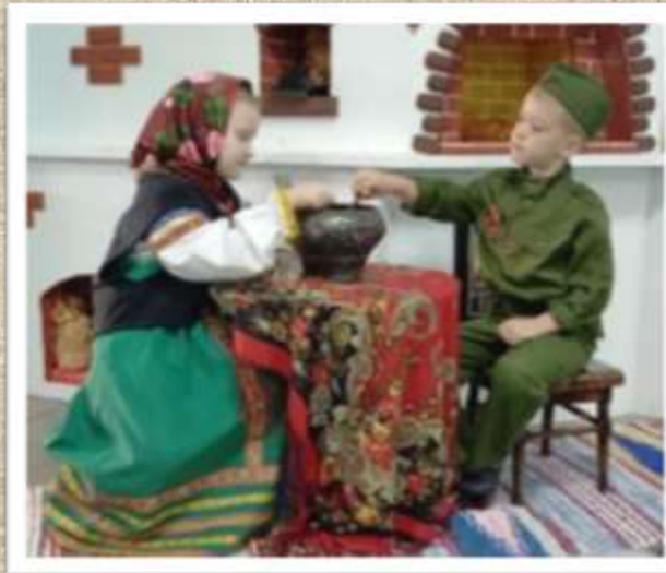
Сказка «Каша из топора»