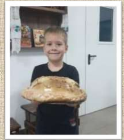
Мастер – класс «Каравай»