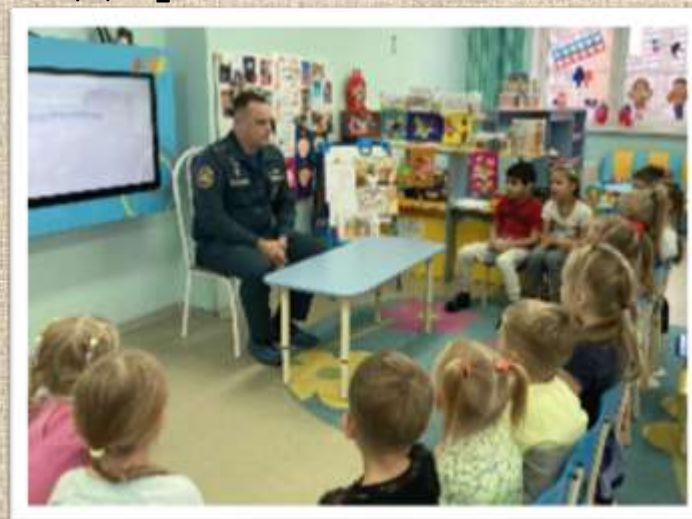
«Разговор о важном»