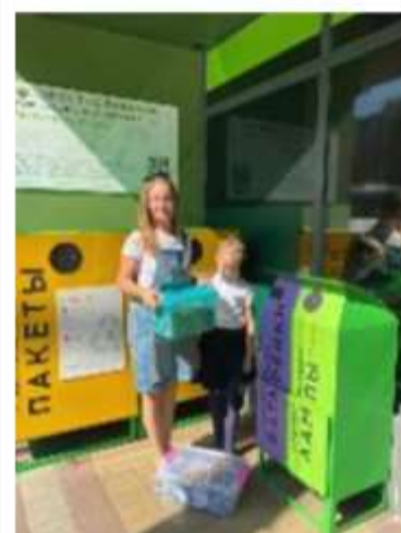
«Акция «Станет лучше на планете если ей помогут дети!»