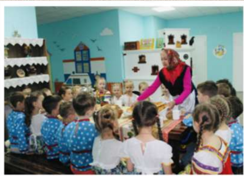
Тематический вечер «Бабушкины сказки»