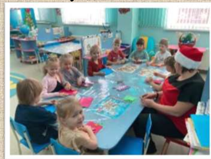
«Мастер – класс «Новогодняя открытка»