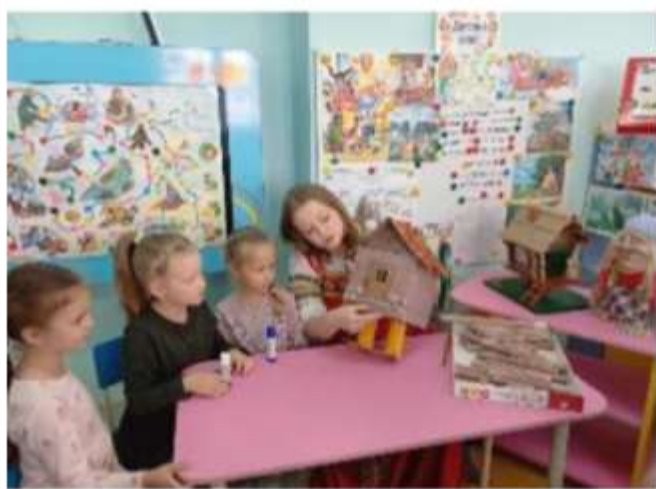
«Мастер – класс «Избушка Бабы Яги»