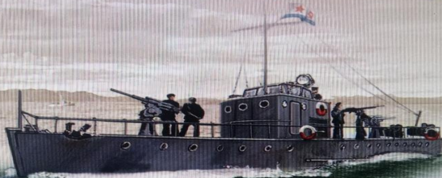
Гвардейский морской охотник ПК-125 тип МО-4

Водоизмещение — 56 т; длина — 26,9 м, ширина — 4,02 м