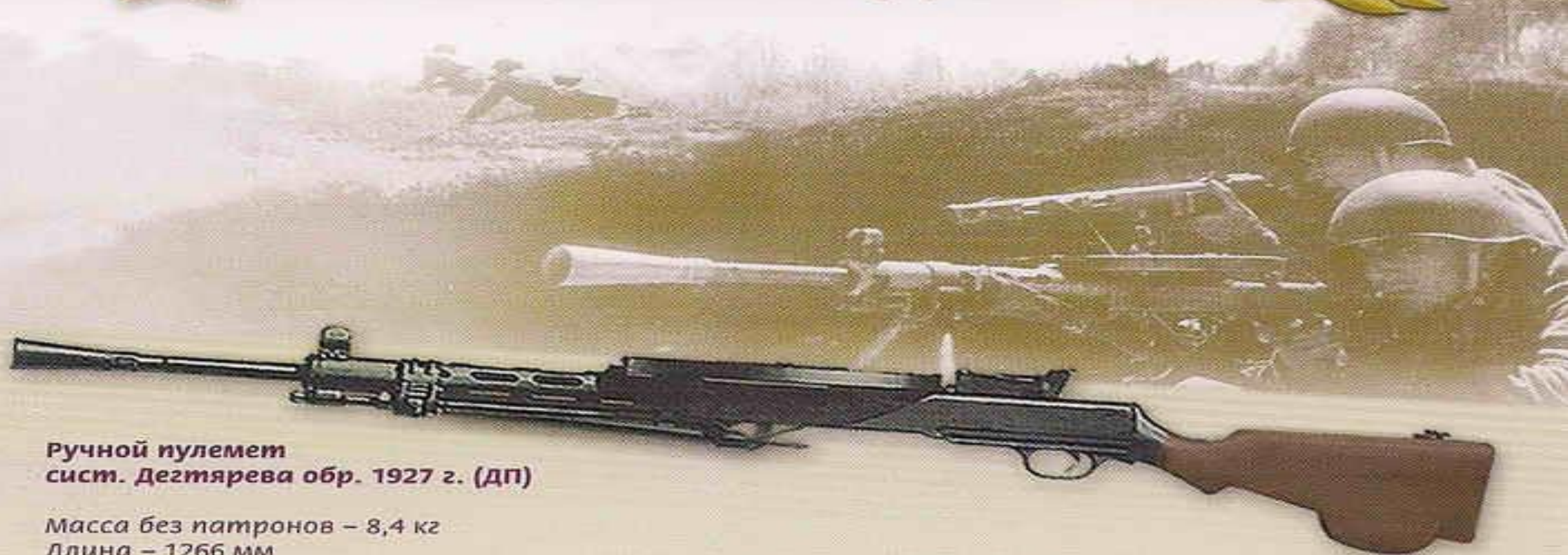
Ручной пулемет сист. Дегтярева обр. 1927 г. (ДП)