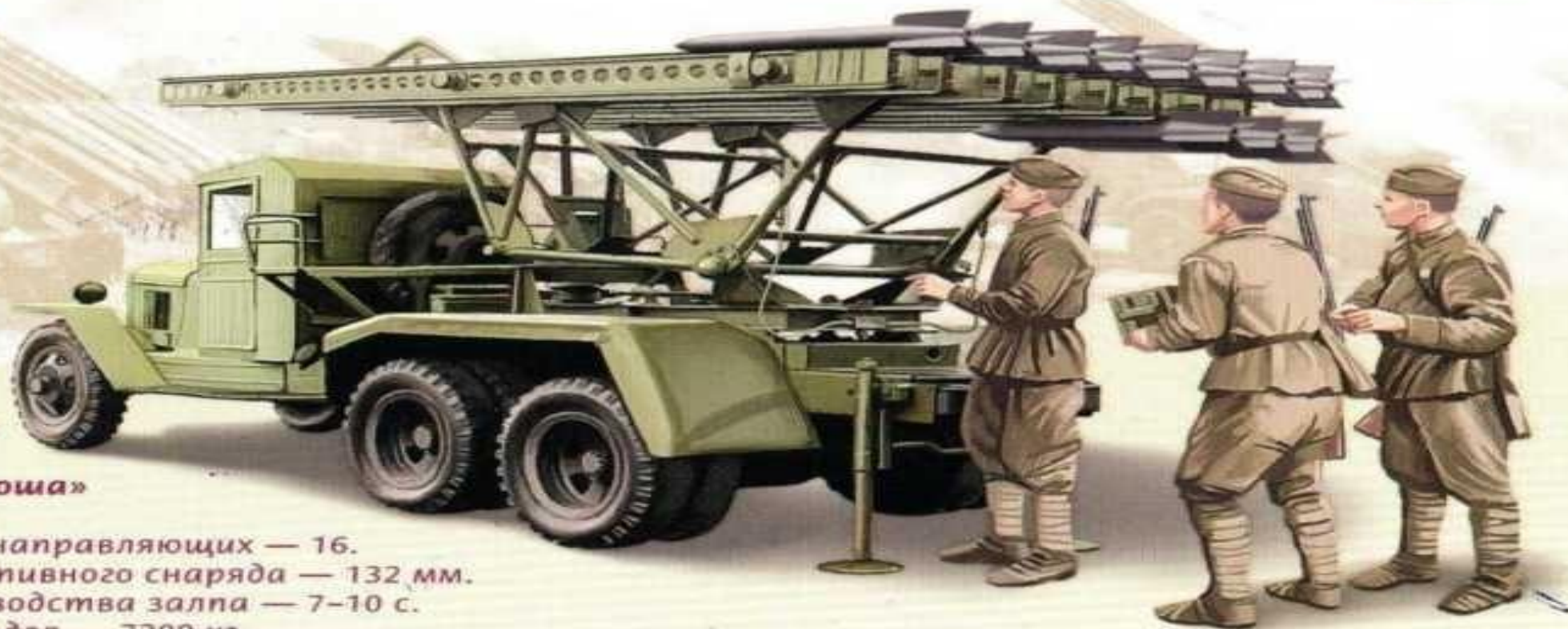
Реактивная установка БМ-13 «Катюша»

Количество направляющих — 16. Калибр реактивного снаряда — 132 мм. Время производства залпа — 7–10 с. Вес без снарядов — 7200 кг, вес со снарядами — 7880 кг. Дальность стрельбы — 8470 м.