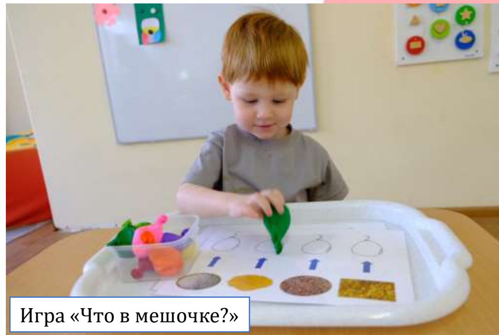
Игра «Что в мешочке?»

Игры на подносе стимулируют развитие мелкой моторики, сенсорного восприятия, координации движений, а также развивают самостоятельность и инициативность