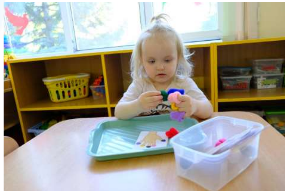
Игра «Учим пальчики»