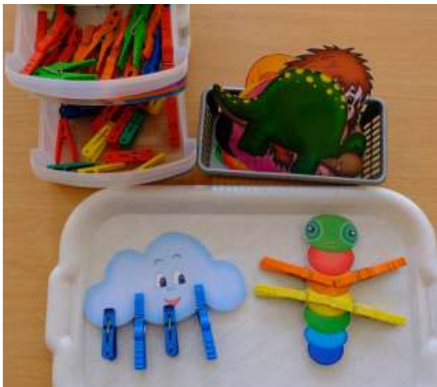
Игра «Разноцветные прищепки»