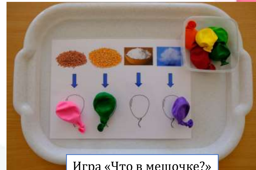
Игра «Что в мешочке?»