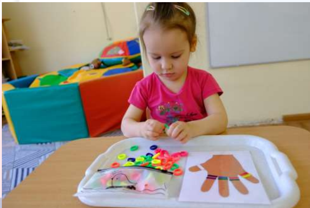
Игра «Разноцветные резиночки»