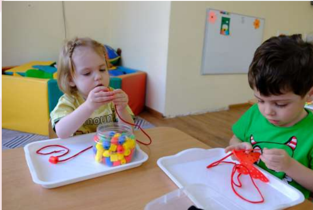
Игра «Собери бусы»