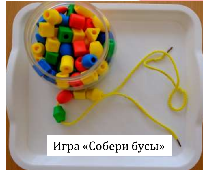
Игра «Собери бусы»