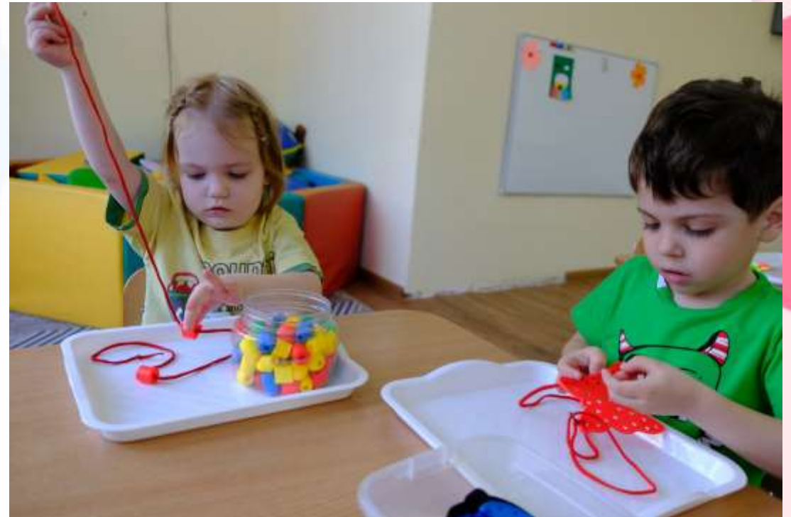
Игра «Послушный шнурочек»