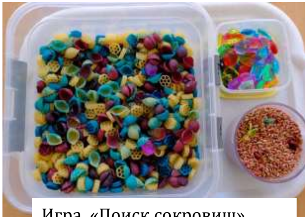
Игра «Поиск сокровищ»