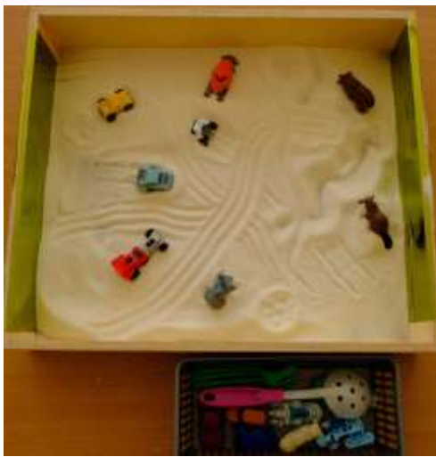
Игра «Волшебный песок»