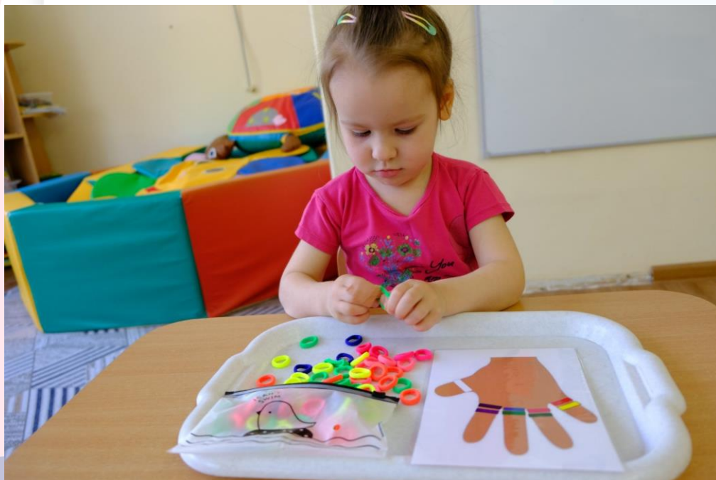
Игра «Разноцветные резиночки»