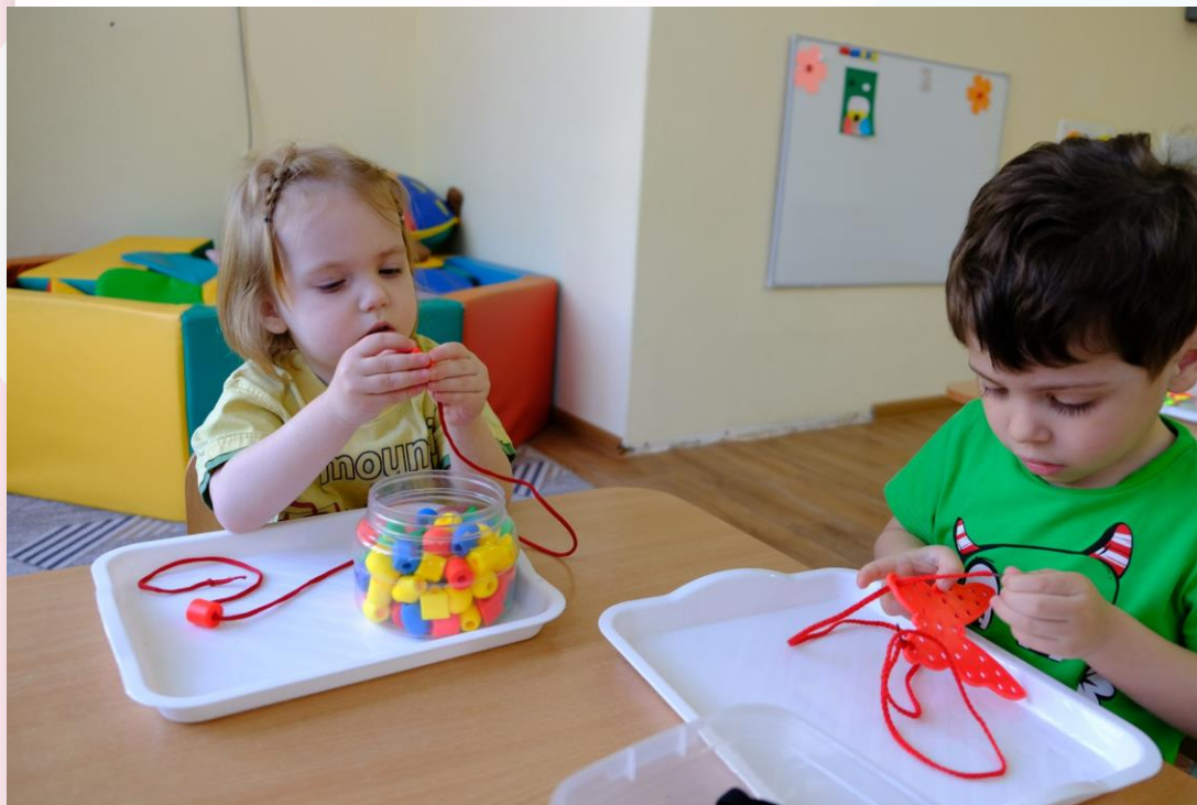
Игра «Собери бусы»