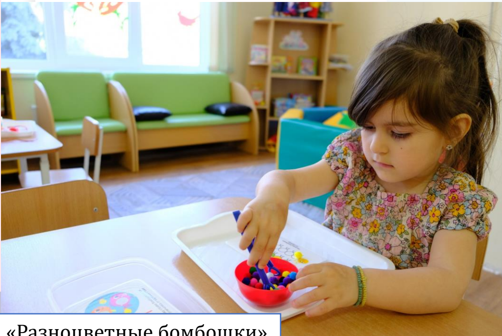
Игра «Разноцветные бомбошки»