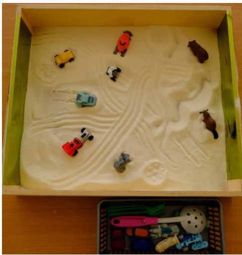
Игра «Волшебный песок»