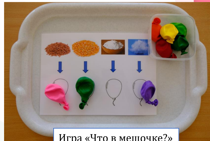
Игра «Что в мешочке?»