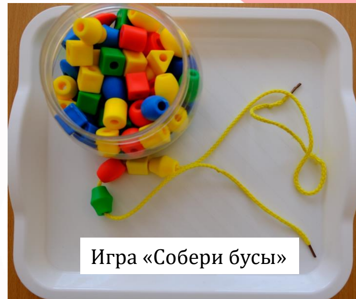
Игра «Собери бусы»