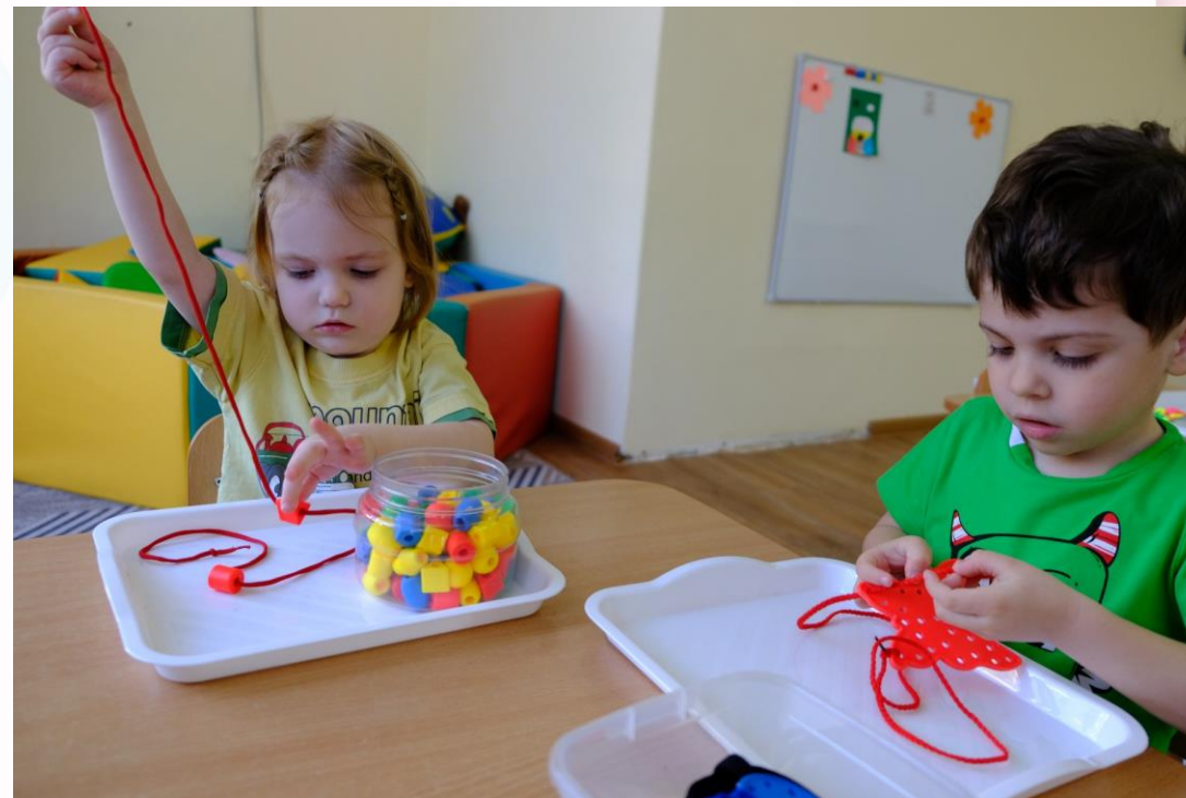
Игра «Послушный шнурочек»