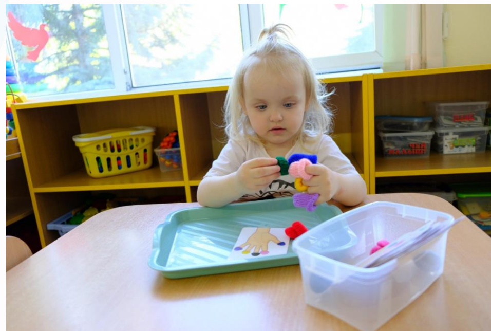
Игра «Учим пальчики»