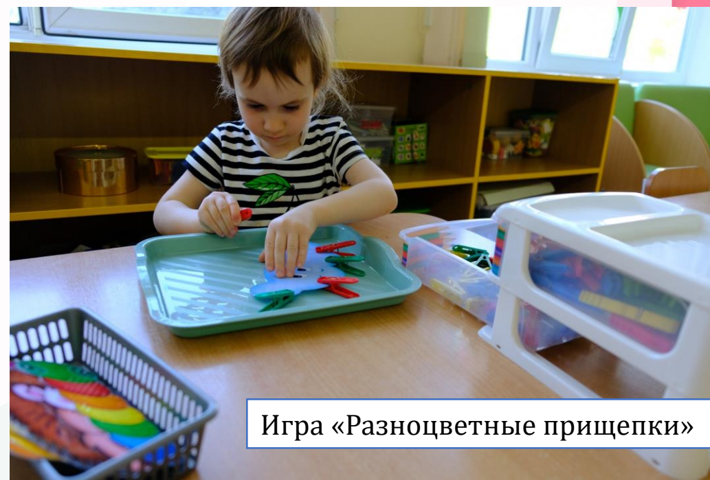
Игра «Разноцветные прищепки»