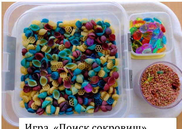
Игра «Поиск сокровищ»