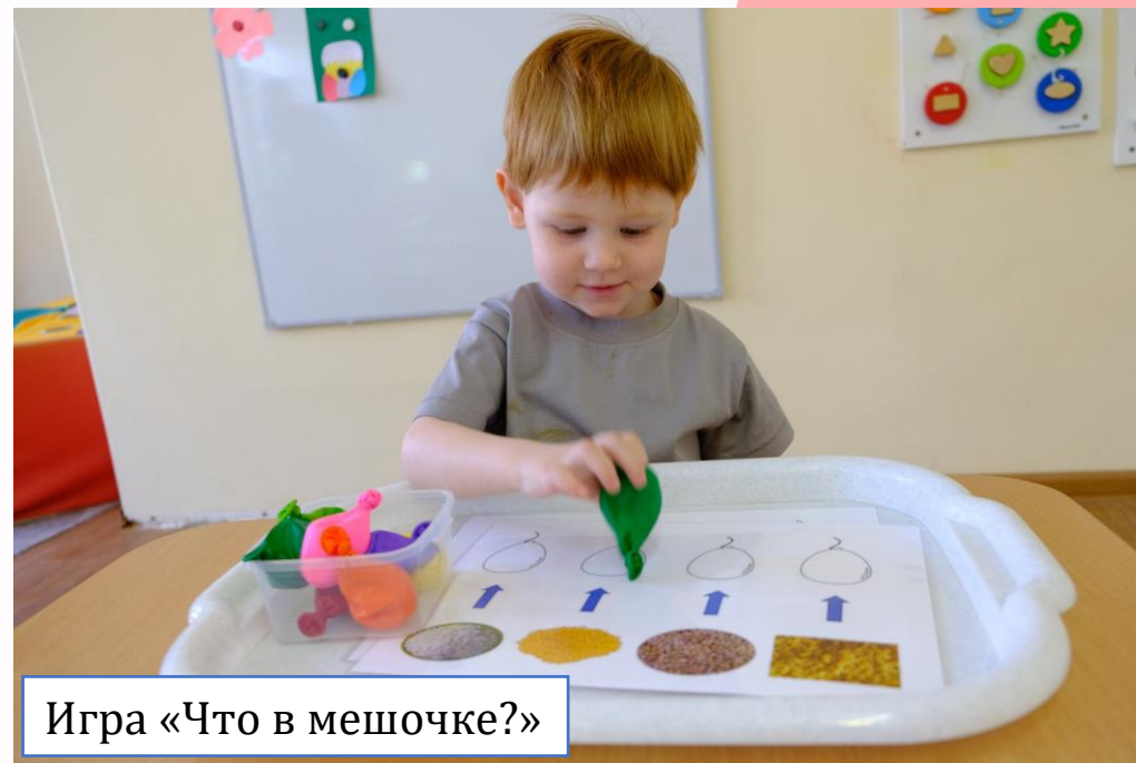
Игра «Что в мешочке?»

Игры на подносе стимулируют развитие мелкой моторики, сенсорного восприятия, координации движений, а также развивают самостоятельность и инициативность