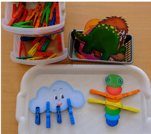
Игра «Разноцветные прищепки»