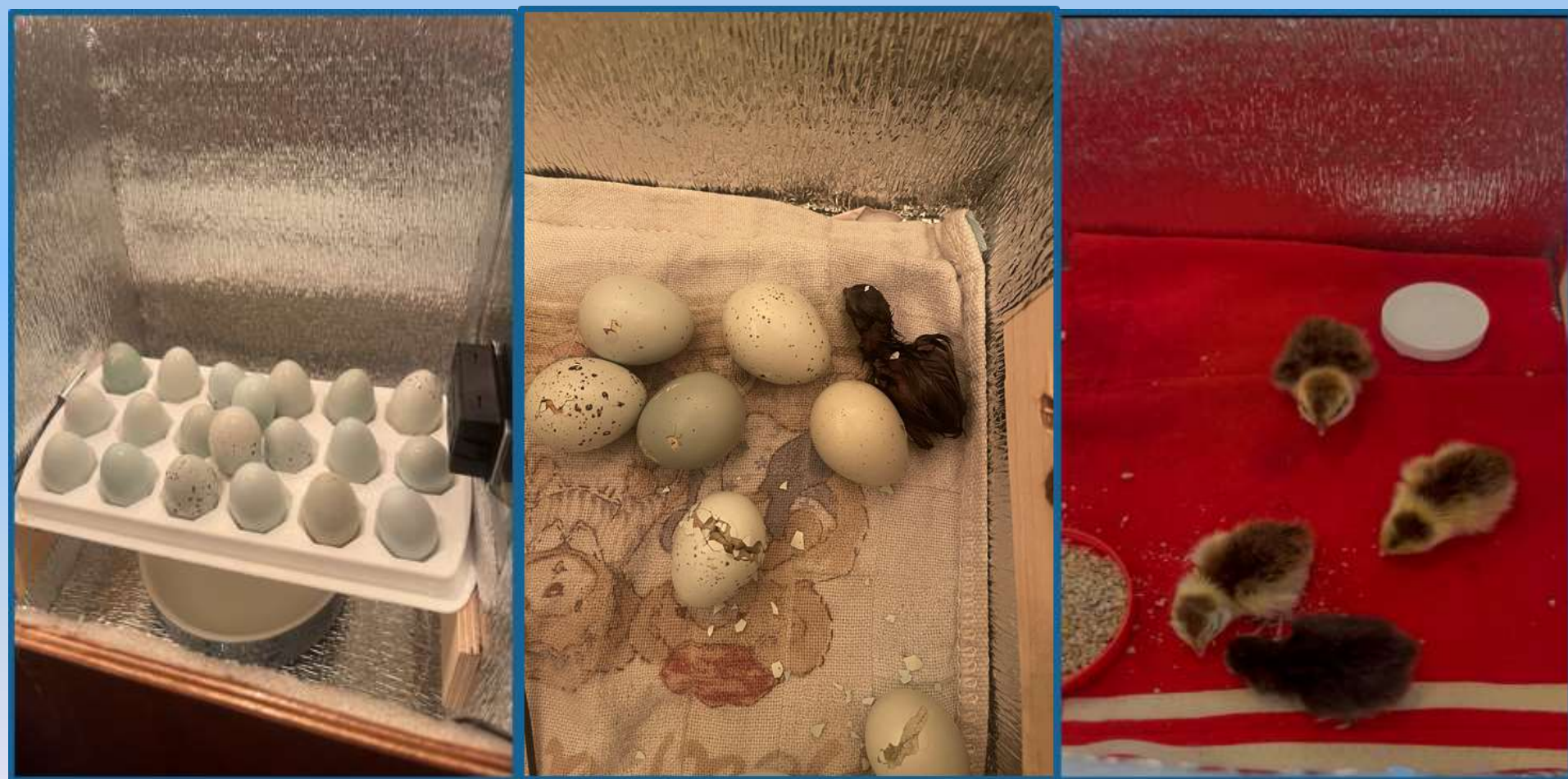
Инкубатор, автор ученик 8 класса