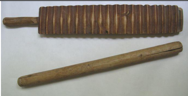
Рубель и качалка