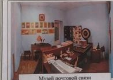
Музей почтовой связи