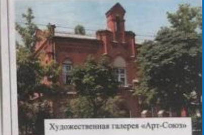
Художественная галерея «Арт-Совоз»