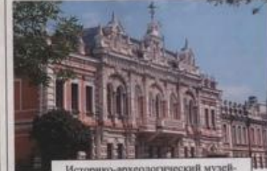
Историко-археологический музей- заповедник им. Е.Д. Фелициной