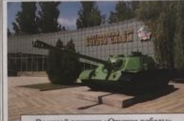
Военной техники «Оружие победы»