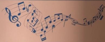
Гимн моего региона