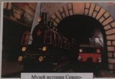
Музей истории Северо- Кавказской железной дороги