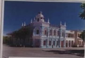
Краевой художественный музей им. Ф.А. Коваленко