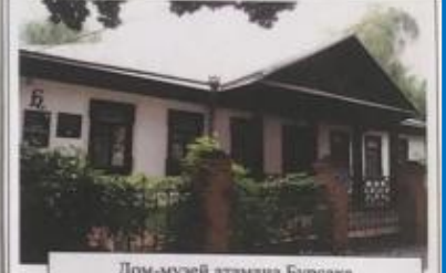
Дом-музей атамана Бурсака