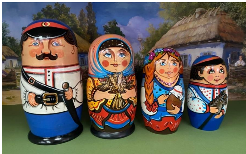
Рис. 2. Матрешки «Казачья семья»

Каждая деталь народного костюма (праздничного и повседневного) являлась свидетельством жизненного уклада. Цветовая гамма была разнообразна, с ярким растительным миром, вышитом на передниках, платках, на рукавах и подоле рубахи.