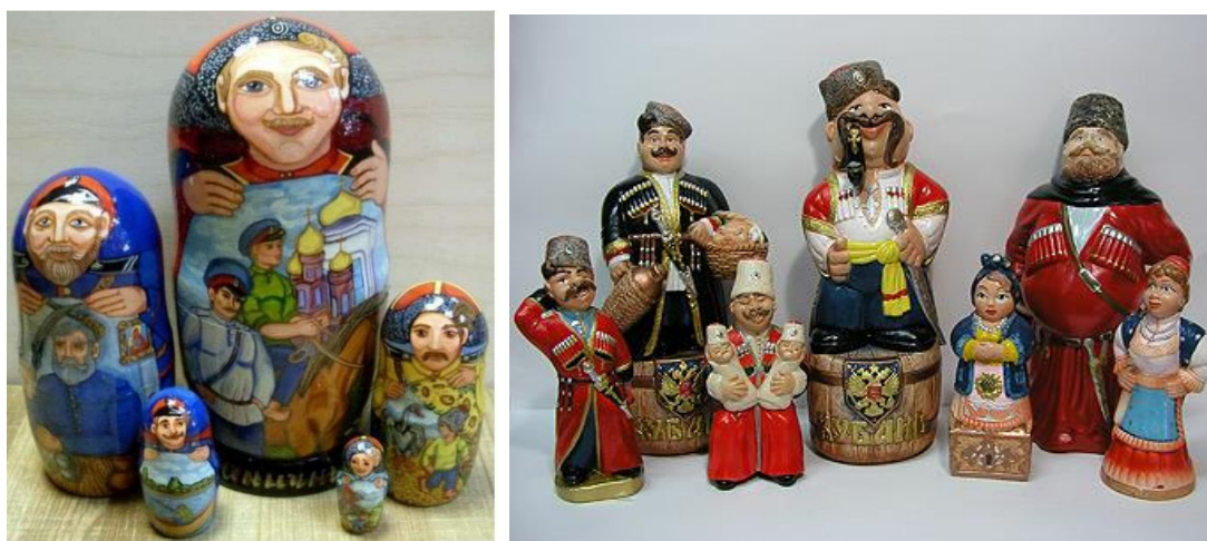
Рис. 1-2. Кубанские сувениры

Слово «Сувенир» произошло от французского слова «память». Сувенир - это знак уважения, признательности, внимания и вежливости. Главная цель сувенира - зафиксировать в памяти его получателя тот факт, что вы с ним знакомы, и вы о нем помните. Разумеется, можно подарить сувенир и близкому человеку, но традиционно сувениры дарят людям, с которыми вы знакомы не настолько близко, чтобы дарить им подарки [2, с.35].