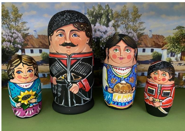
Рис. 3. Матрешки «Казачья семья»

20 век. Отец, современный казак с кинжалом. Костюм казака включал в себя папаху, черкеску (кафтан), бешмет (верхняя одежда), башлык (длинный капюшон на завязках), шаровары с лампасами и сапоги. Кинжал был элементом формы всех казаков. Свой первый кинжал казак получал в подарок в возрасте 3-5 лет. С этого момента кинжал становился его постоянным спутником до самой смерти.