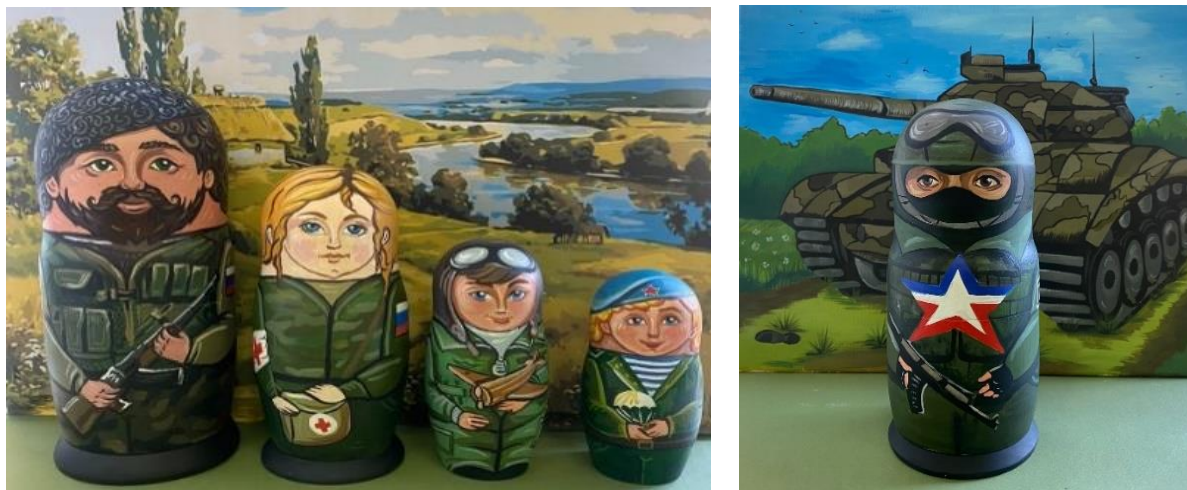
Рис. 5. Матрешки «Казачья семья»

женщин, которые ждут своих мужей и сыновей с фронта, олицетворяют домашний очаг и мирное небо над головой. Сыновья - продолжатели казачьей династии - представители Военно-воздушных сил (ВВС РФ).