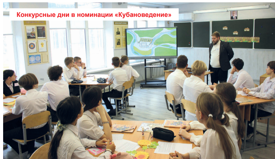
Конкурсные дни в номинации «Кубановедение»

В своих ответах на вопросы конкурсанты рассуждали о необходимости непрерывного образования, говорили о качестве знаний, выстраивании межпредметных связей, высказывали предложения по оптимизации