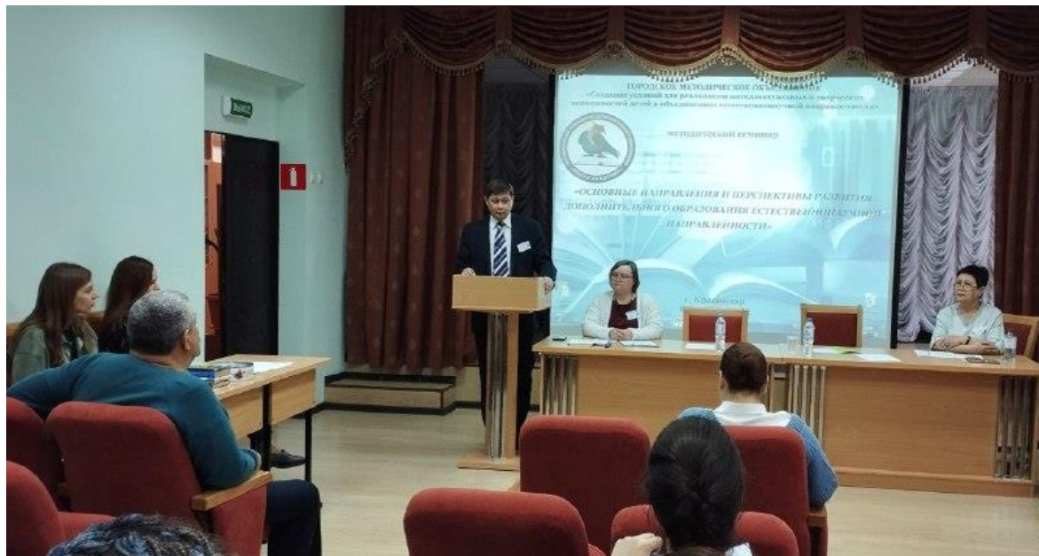
Секция 1. Творческая мастерская