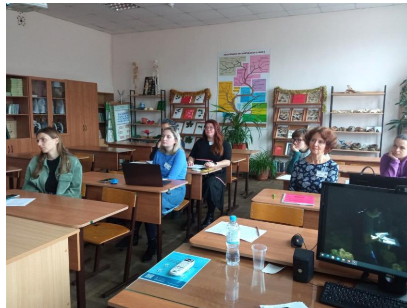
Секция 2. Проектная лаборатория