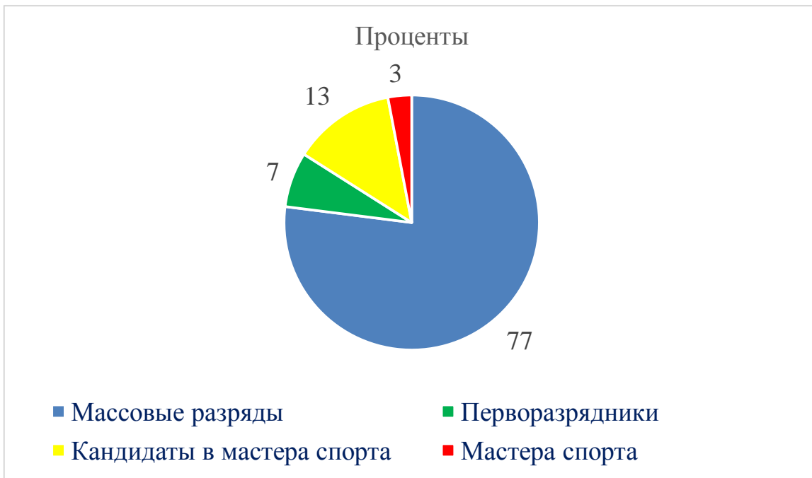
Рис. Процентное соотношение выполнения разрядных нормативов

На отделении спортивной акробатики и прыжков на батуте подготовлено 494 спортсмена массовых разрядов, 42 – перворазрядника, 80 – кандидатов в мастера спорта, 19 - мастеров спорта. 15 спортсменов входят в основной состав сборной команды Краснодарского края по спортивной акробатике и АКД, 12 человек – в резервный состав.