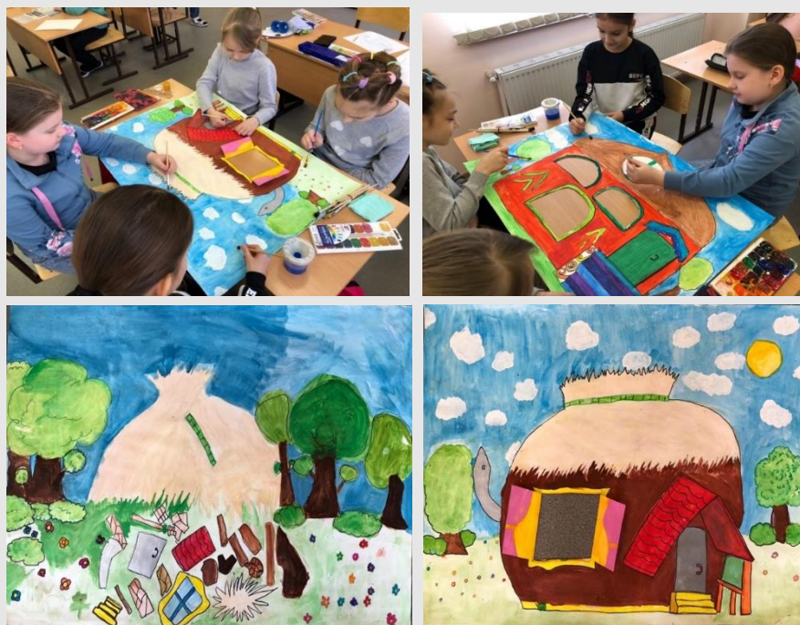
Рис. 9. Изготовление учащимися эскизов фонов для будущей постановки в натуральную величину

Сначала изображается рисунок карандашом по выполненному ранее эскизу. После выполняется работа в цвете (гуашью).