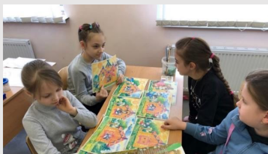
Рис.6 Обсуждение с обучающимися сказки «Теремок»

Марионетка (от итал. marionetta) - разновидность управляемой театральной куклы, которую кукловод приводит в движение при помощи нитей или металлического прута. Появление марионетки принято относить к XVI веку.