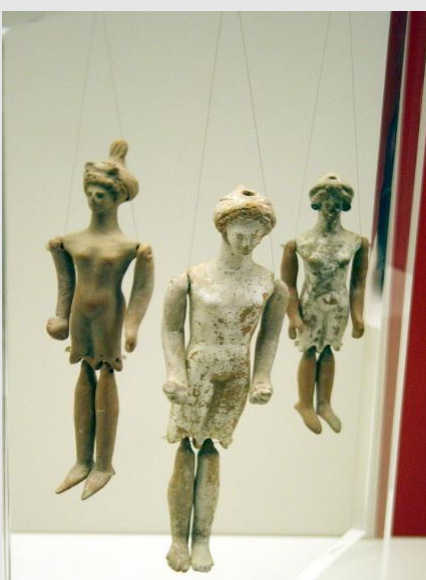
Рис.1 Древнегреческие терракотовые куклы, V-IV века до н. э. (Афины)

Искусство кукольников очень старое - в разных странах возникали свои,