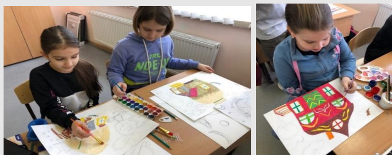
Рис. 8. Изготовление учащимися эскизов фонов для будущей постановки