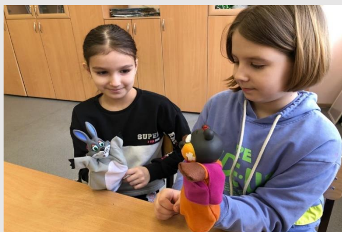
Рис.4 Знакомство детей с перчаточной куклой

Особенностью театра теней является то, что все используемые куклы плоские. Кукла имеет четкий ярко выраженный силуэт, поэтому она как правило изображена в профиль. Для представления понадобится хорошее освещение и плоский экран.