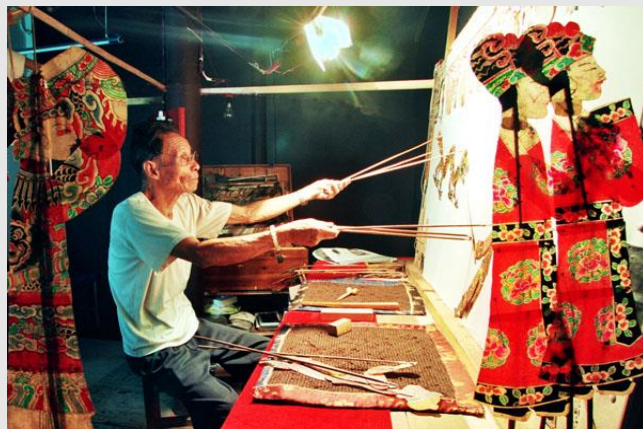
Рис. 2 Китайский кукольный театр

Другие три направления использовали в представлениях тростевые куклы, перчаточные или марионетки на верёвочках или проволоке. Многообразие форм представления в кукольном театре определяется разнообразием видов кукол и их систем управления. Различают куклы-марионетки, тростевые, перчаточные, планшетные. Куклы могут иметь размер от нескольких сантиметров до 2-3 метров .