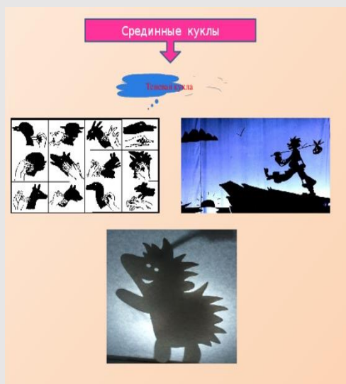
Рис.5 Разновидности срединных кукол

Перчаточная кукла надевается на руку кукловода и управляется пальцами и кистью.