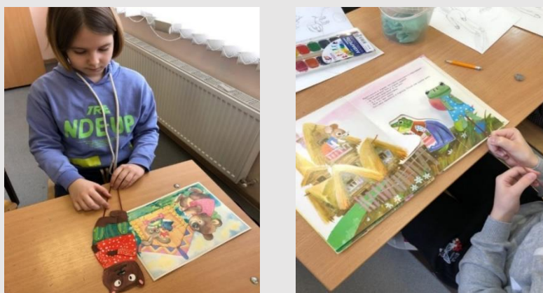
Рис.7 Выбор учащимися персонажа сказки

Цель: каждый учащийся анализирует и изучает особенности своего персонажа, рисует на листе А4 эскиз по своему представлению.