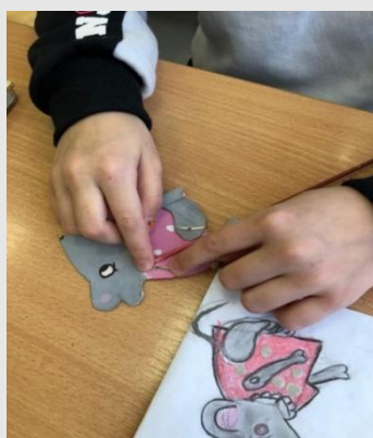
Рис.10. Изготовление учащимися шарнирной, бумажной куклы-персонажа постановки в натуральную величину