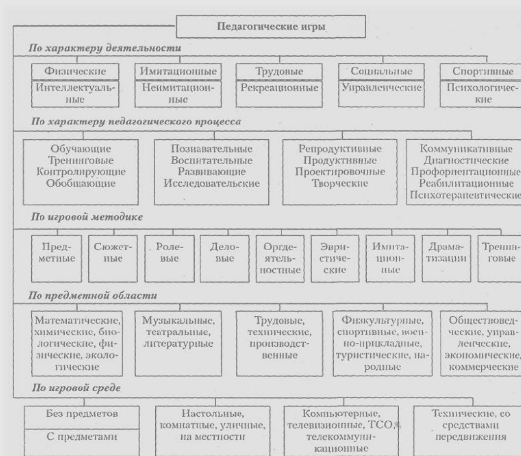
Рисунок 1 - Функции и классификации педагогических игр