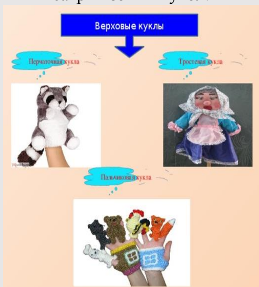
Рис.3 Разновидности верховых кукол

Верховые куклы - те, что во время спектакля находятся над ширмой, выше работающего с ней кукольника.