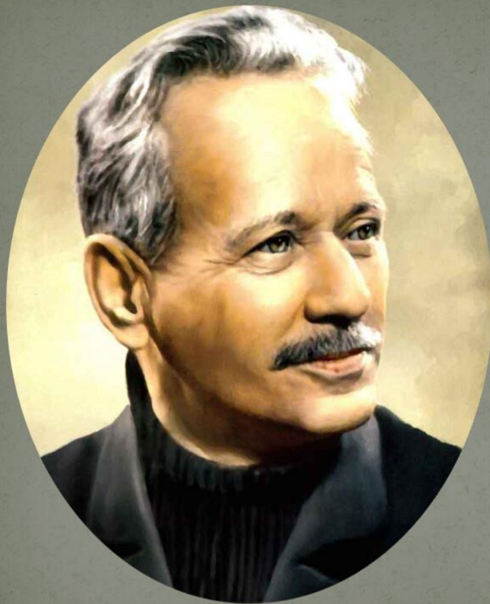
Михаил Александрович Шолохов