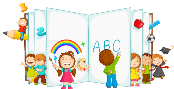
Организация деятельности обучающихся