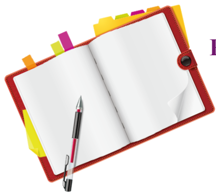
Разработка критериев оценки