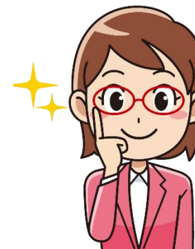
Организация деятельности педагога