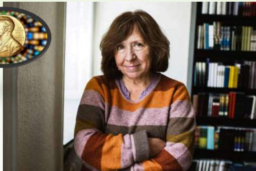
Светлана Алексиевич – советская и белорусская писательница